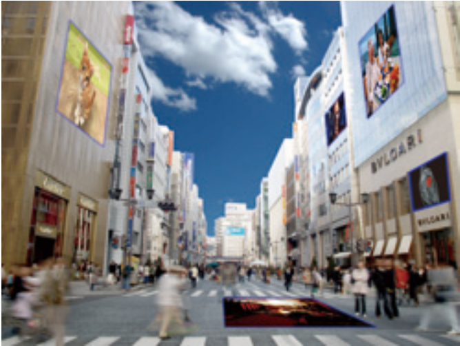
Virtual Video Screen 利用イメージ

Virtual Video Screen は、ディスプレイを通じて、ユーザーに対し実世界と仮想スクリーンが同じ空間を共有しているかのような印象を与えることができます。